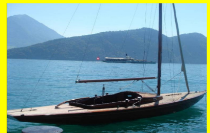
Ein Segeltörn mit dem schönsten Schiff auf dem Vierwaldstättersee mit Nachtessen?