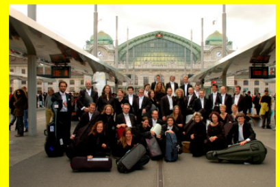
Eine Generalprobe des Basler Kammerorchesters mit einer weltberühmten Solistin?