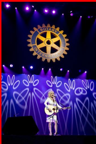
Dolly Parton, Fonder of The Dollywood Foundation during fourth plenary session. RI Convention, 23 June 2010, Montréal, Québec, Canada

Hinweis: Rotary International ist auch auf der Internetplattform Facebook präsent. www.facebook.com/rotary