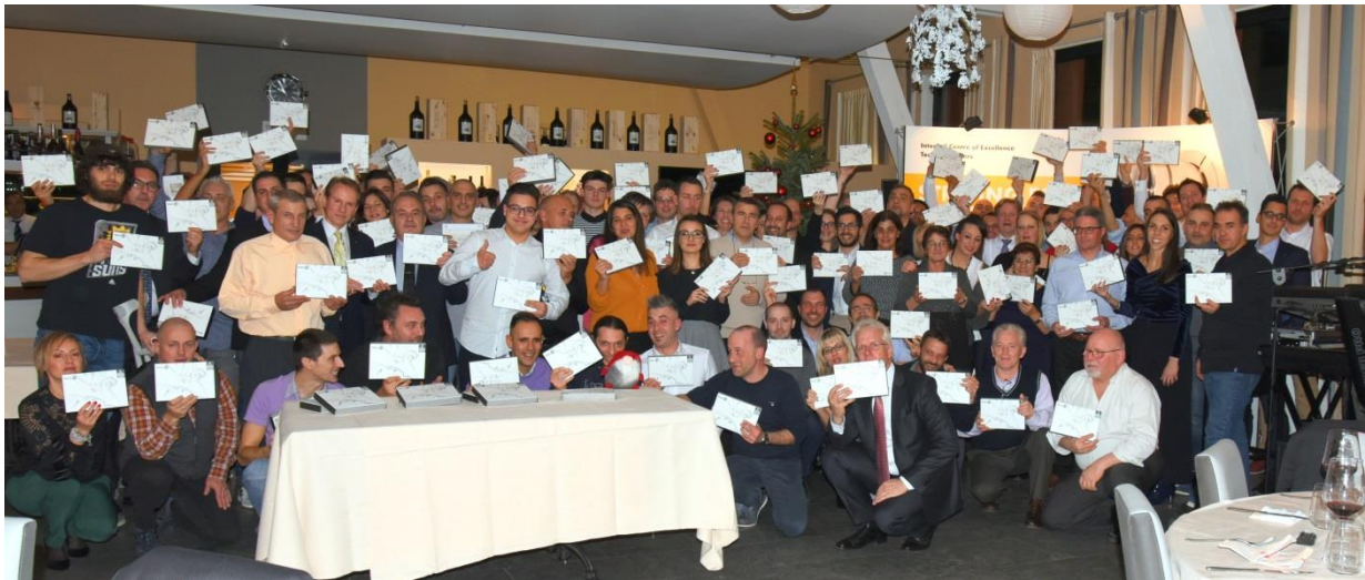
Attività di cioccolato PolioPlus: festa di Natale presso l'Interroll SA in Ticino: ogni dipendente ha ricevuto una scatola PolioPlus dal Rotary Club Locarno.