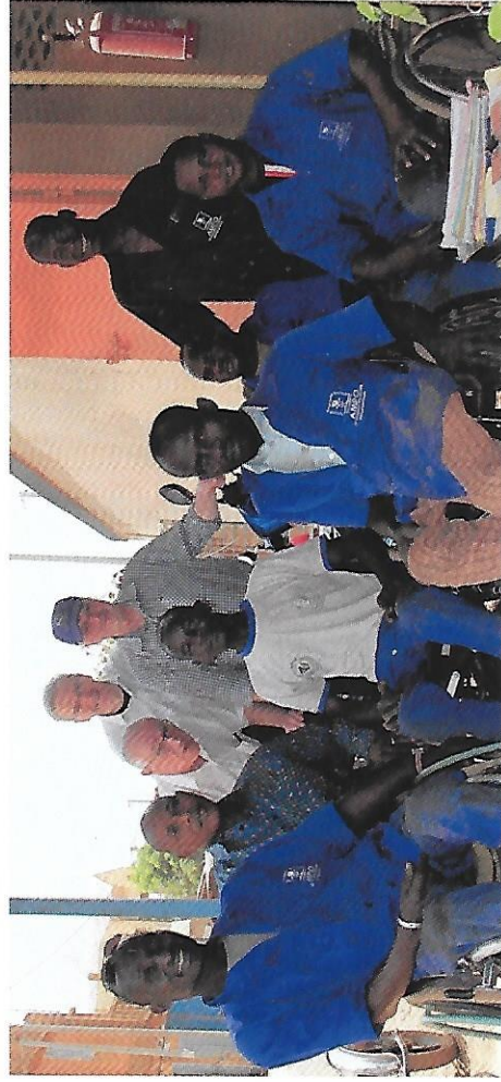
Il personale dell'officina meccanica di Ouagadougou: tutti i collaboratori sono vittime della Polio.