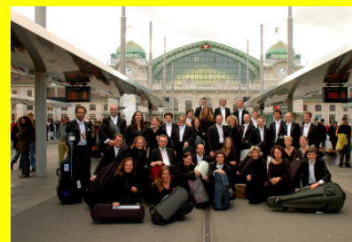
Una prova generale con l'Orchestra da Camera di Basilea, con un solista di fama mondiale?