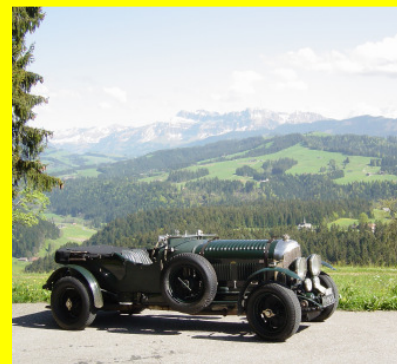
Un'uscita con una Bentley del 1927 o con una Jaguar E-type?