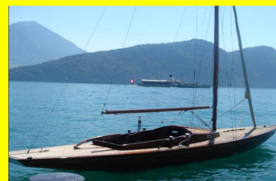
Veleggiare con il più bello scafo esistente sul Lago die Quattro Cantoni, con cena?